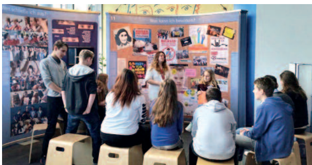
Ausstellung in der Anne-Frank-Schule