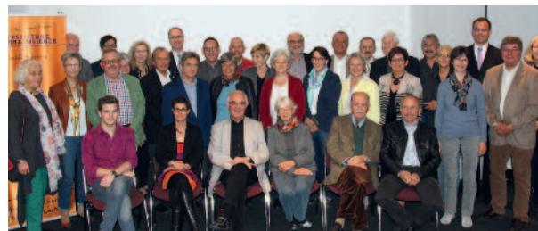
Teilnehmer/innen des 10. Stifterforums

Stiftungsrates gab es Austausch und Gespräche bei einem leckeren Imbiss, zu dem die Sparkasse eingeladen hatte. Die Bürgerstiftung bedankt sich für diesen netten Rahmen.