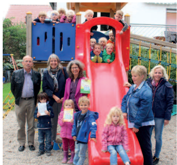
Kinder der Kita "Gelstertaler Spatzen" in Hundelshausen präsentieren die Angebote der Witzenhäuser Familienhäuser

Durch die Öffnung der Einrichtungen wurden diese zu Treffpunkten für Familien und für alle Generationen. Ob beim Gartenprojekt, dem Spielesachmittag, dem Großeltern-Café oder dem multikulturellen Kochnachmittag, die Lebensqualität und das Miteinander vor Ort werden gestärkt. Koordiniert wird das Projekt von der Ev. Familienbildungsstätte - Mehrgenerationenhaus.