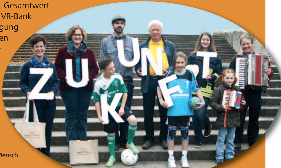
„Unser Verein fit für die Zukunft“ - Thema des Wettbewerbs Mach MitMensch

Ideen und Aktivitäten für einen zukunftsfähigen Verein. Am 12. Juni findet im E-Werk in Eschwege die Abschlussveranstaltung mit Preisverleihung statt und wir freuen uns darauf, so viele engagierte Menschen aus dem Werra-Meißner-Kreis zu Gast haben und auszeichnen zu dürfen.