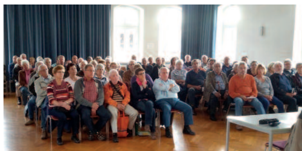
Teilnehmer/innen des Fachvortrags Erbrecht

bestimmen. Die Bürgerstiftung bietet hierfür Stiftungsfonds an, die den Namen des Stifters tragen können und nach seinen Wünschen und Vorstellungen über das eigene Leben hinaus wirken.