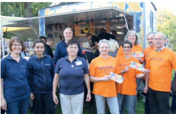
Das Team der Juice-Box mit dem Vorstand der Bürgerstiftung

Das Hospiz- und Palliativnetz Werra-Meißner hat eine neue Geschäftsstelle in Eschwege eingerichtet, die von der Bürgerstiftung mit unterstützt wurde.